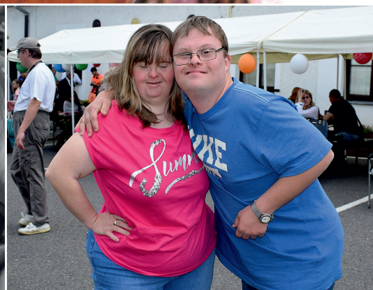
3. kategorie: Jak to vidí klienti Svět pohledem těch, jimž Charita slouží