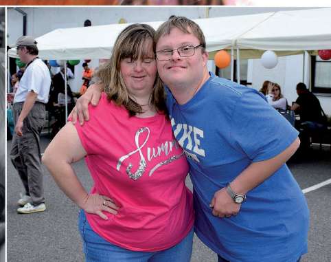
3. kategorie: Jak to vidí klienti Svět pohledem těch, jimž Charita slouží