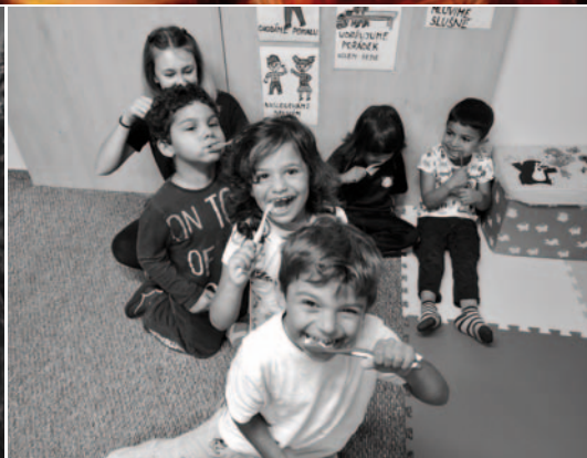
2. kategorie: Život kolem nás Svět Charity pohledem zaměstnanců a dobrovolníků