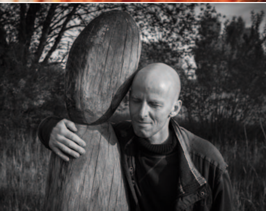
1. kategorie: Portrét Svět ve tvářích lidí Charity

Patronaci nad kategorií „Jak to vidím já“ převzal kolektivní systém ASEKOL.