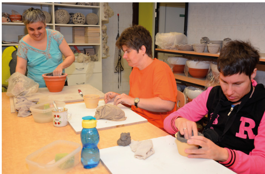
• Zrakově handicapovaní zaměstnanci pracují ve Vlaštovičkách alespoň na část úvazku, foto V. Herman