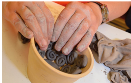
• Detail z práce v keramické dílně, foto V. Herman