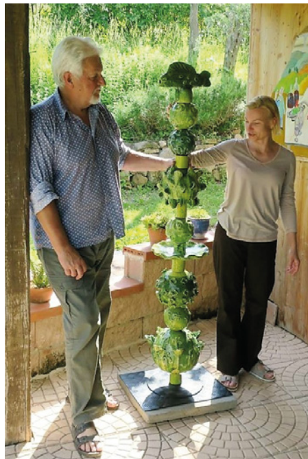
• Keramický totem z Vlašoviček