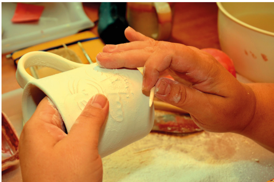
• Práce v keramické dílně ve Vlašovičkách