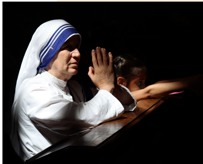
CHARITA OPAVA, FIRMA ASEKOL A SLEZSKÉ ZEMSKÉ MUZEUM VÁS ZVOU NA 15. ROČNÍK CELONÁRODNÍ FOTOGRAFICKÉ SOUTĚŽE