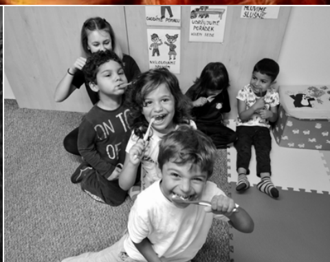
2. kategorie: Život kolem nás Svět Charity pohledem zaměstnanců a dobrovolníků