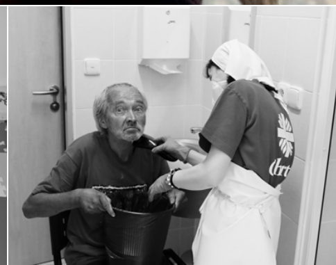
3. kategorie: Jak to vidím já Svět pohledem těch, jimž Charita slouží