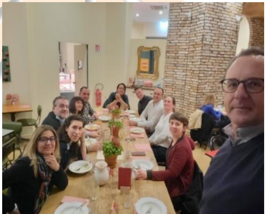
Jeden z okamžiků projektového setkání v Miláně

Je to velmi užitečný nástroj pro partnery, jak dále zhodnotit materiál, který byl vyroben, a to i po skončení projektu.