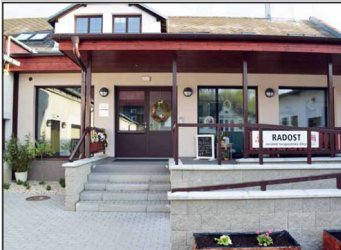
Výroční zpráva 2021 Charita Opava