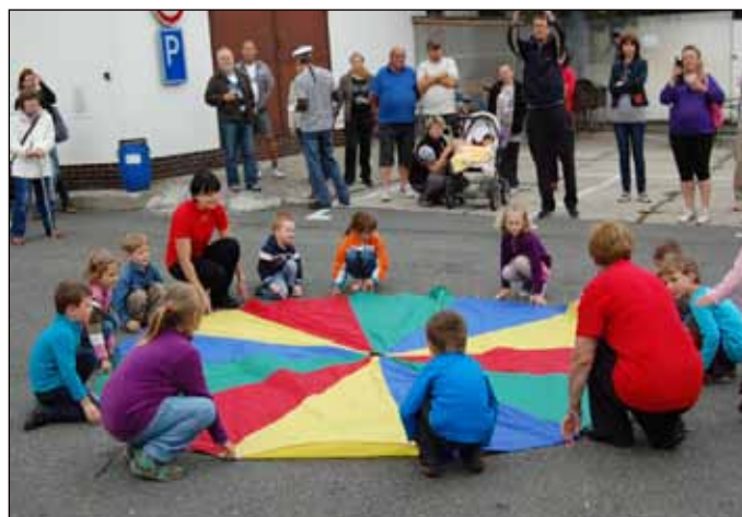
Vystoupení dětí z Mateřské školy v Jaktáři se líbilo.