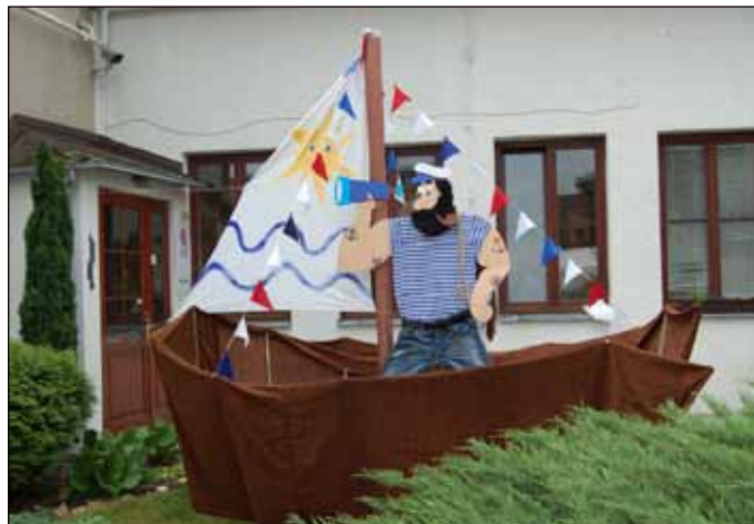
Prostranství před budovou ředitelství zdobí velký koráb s námořníkem.