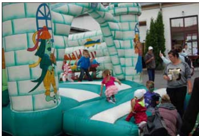
Skákací hrad patří každoročně mezi největší dětská lákadla.