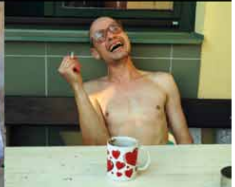
3. kategorie: Jak to vidím já Svět pohledem klientů Charity