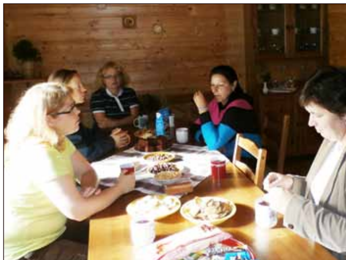
Po dlouhém pochodu bylo dobře v chatě, kde přišlo na řadu káfičko a ochutnávka moučníků z domácích zdrojů.