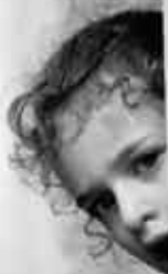
1. kategorie: Portrét Lidé Charity a jejich tváře

Patronát nad soutěžní kategorií pro klienty převzala firma ASEKOL.