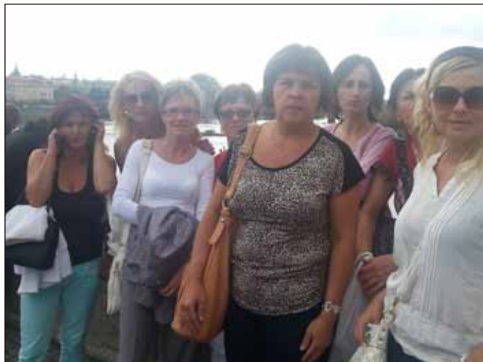
Ještě fotografie z Karlova mostu. Pečovatelky už se těší, až půjdou večer na muzikál. Aida všechny nadchla.