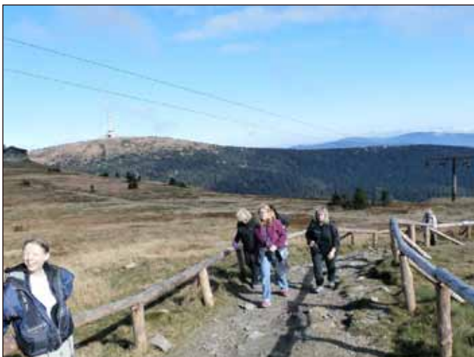
Túra byla náročná - a někoho i bolela. V cíli se však všechny sestřičky usmívaly a byly rády, že výšlap absolvovaly.

Další střediska – Denní stacionář pro seniory a Wellness centrum – budou se syndromem vyhoření bojovat na jaře.