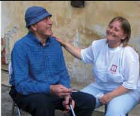
2. kategorie: Život kolem nás Svět pohledem zaměstnanců Charity