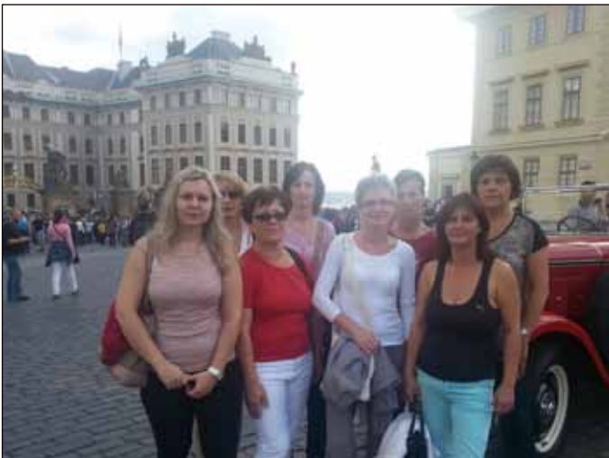
Pěkný zářijový den a procházka dopolední Prahou. Prohlídka pamětihodností, ale i nákupy. Komu by se to nelíbilo?