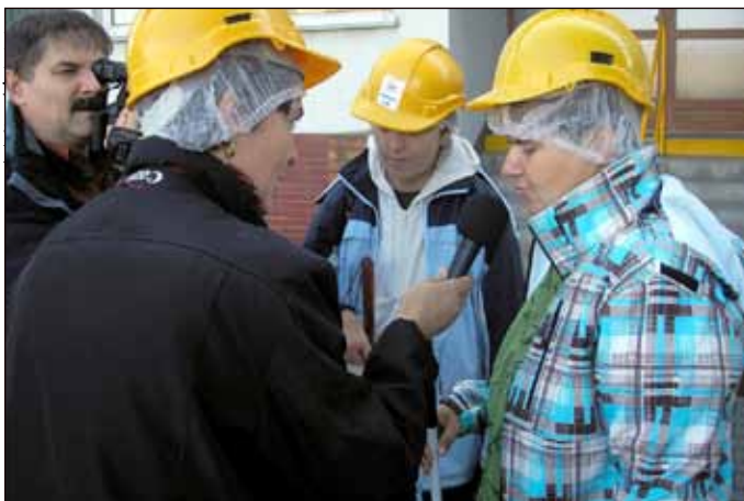
Klienti z Vlastoviček se ale také na chvíli stali mediálními hvězdami – z exkurze vznikla rozhlasová reportáž, připravuje se rovněž krátký videodokument.