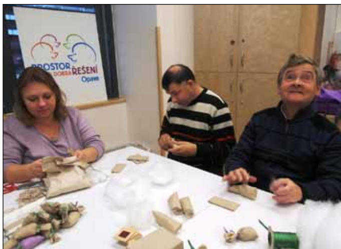
Výrobky klientů Domu sv. Cyrila a Metoděje a Chráněné dílny Vlaštovičky si můžete koupit i vy v obchodním centru Breda.

Originální výrobky klientů Domu sv. Cyrila a Metoděje a Chráněné dílny Vlaštovičky si mohou zájemci koupit téměř každý pátek od 13 do 17 hodin a sobotu od 9 do 14 hodin v „Prostoru pro dobrá řešení“ obchodního centra Breda. Jedinečné vánoční dárky potěší hned dvakrát, protože jejich koupí podpoříte handicapované osoby převážně se zrakovým a duševním onemocněním.