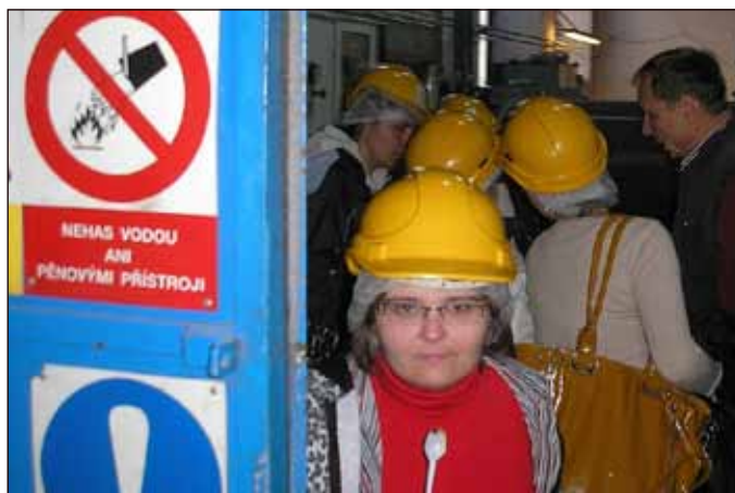
Návštěvníci z Vlastoviček si mohli mnohé ze surovin, polotovárů či nástrojů osahat. Ale nejen to - nezbytnou součástí exkurze bylo ochutnávání různých šťáv, melas a polotovárů.