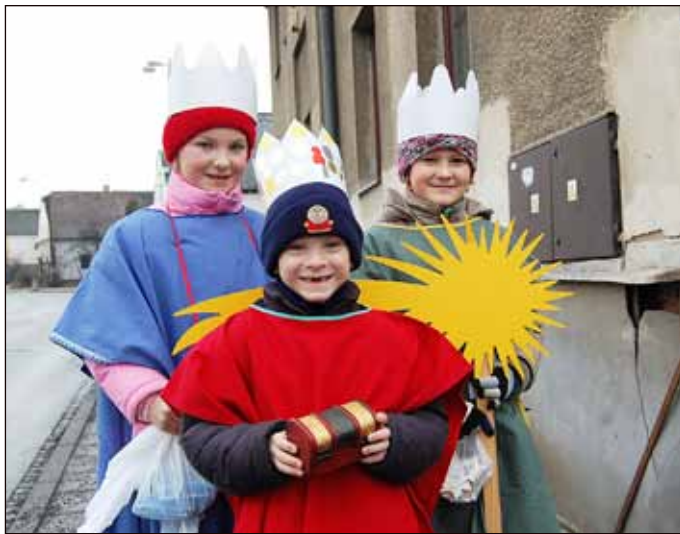
Koledníci z Církevní základní školy sv. Ludmily v Jaktáři určitě nebudou chybět ani při Tříkrálové sbírce 2014. Takhle jsme je zachytili letos v lednu.

Tři chytré mobilní telefony SAMSUNG GALAXY YOUNG čekají na koledníky, kteří se v lednu 2014 zúčastní Tříkrálové sbírky, požádané Charitou Opava. Ale to není jediná novinka, která bude doprovázet v lednu příštího roku tradiční dobročinnou sbírku, vstupující již do čtrnáctého ročníku.