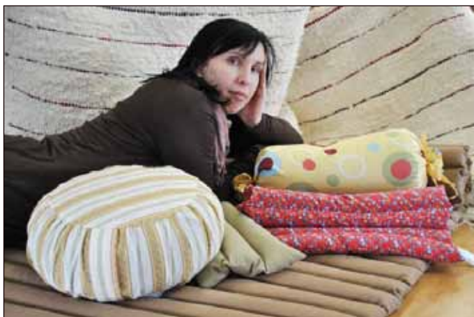
Tolik žádané pohankové polštáře a další výrobky z pohanky můžeme vyrábět také díky podpoře NADACE OKD.