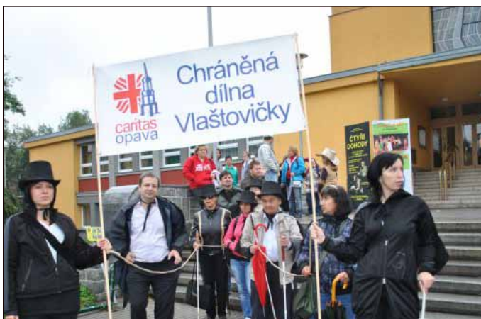
Zástupci organizací, jejichž projekty finančně podporuje Nadace OKD, se v září roku 2012 zúčastnili karvinských Hornických slavností. Zmíněná nadace je pozvala, aby přišli do karnevalového průvodu. Charita Opava nemohla chybět.

Charita Opava zaměstnává více než 200 osob, z toho je 130 zdravotně handicapovaných. Dalším tisícovkám jsme již za téměř čtvrtstoletí naší existence pomohli. Le-dacos z této pomoci bylo možné i díky NADACE OKD, které srdečně děkujeme.