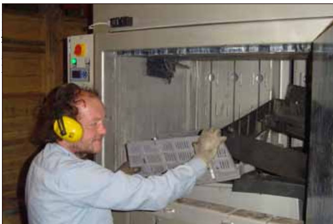
Lis na plastový odpad, pořízený i díky NADACI OKD, zaměstnává osoby, které ji jinak hledaly na trhu práce uplatnění jen těžce.