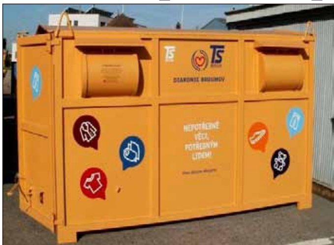
Textil, který skončí v těchto sběrných kontejnerech Diakonie Broumov, pomůže zaměstnávat zdravotně či sociálně znevýhodněné občany.

Poslední. Tento přívlastek nejspíše případně sbírce šatstva, kterou uspořádala Charita Opava ve dnech 14. a 15. října. Tradiční sbírku šatů, určenou již tradičně pro Diakonii Broumov, letos doprovázel nezájem občanů.