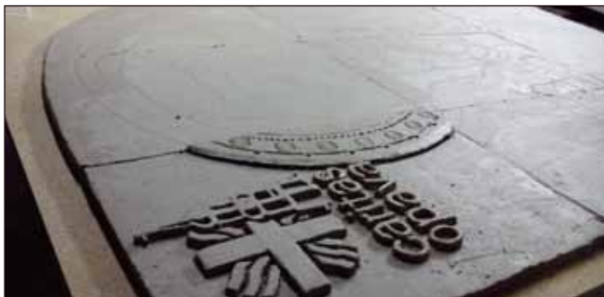
...i loga Charity Opava.