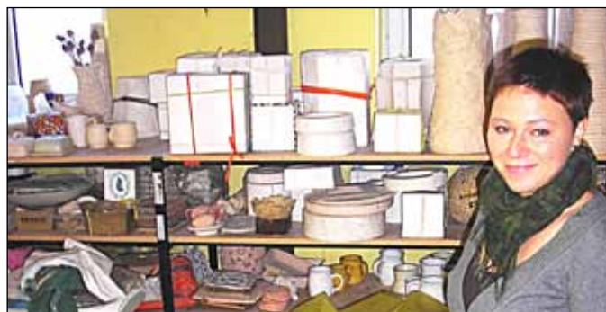
Autorka Zuzana Bartáková.