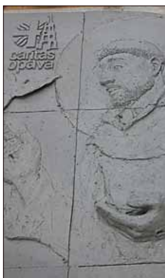
Svatá Anežka a svatý František na domovních znameních, která ještě čekají na závěrečnou glazuru. Jejich konečnou podobu budete moci spatřit nejpozději 13. listopadu při slavnostním odhalení.