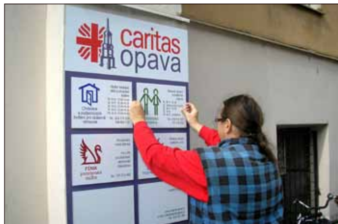
Pracovník firmy Re-tisk připevňuje orientační tabuli na dům sv. Františka.