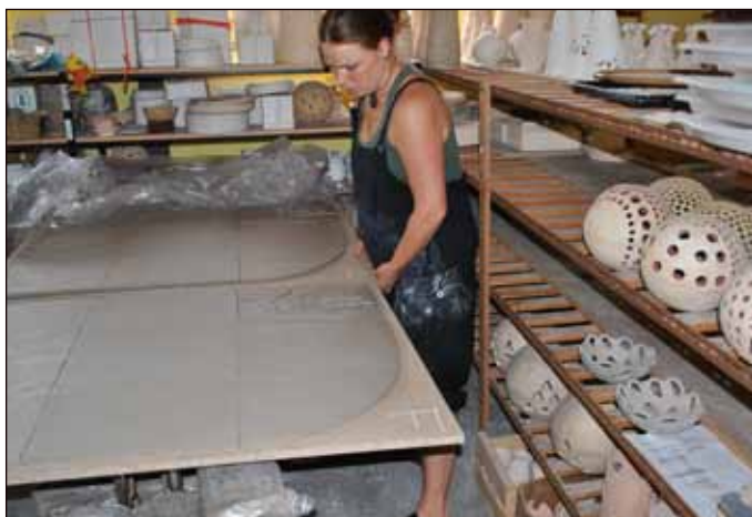
Na keramické ploše postupně vyvstávaly obrysy obou světců...