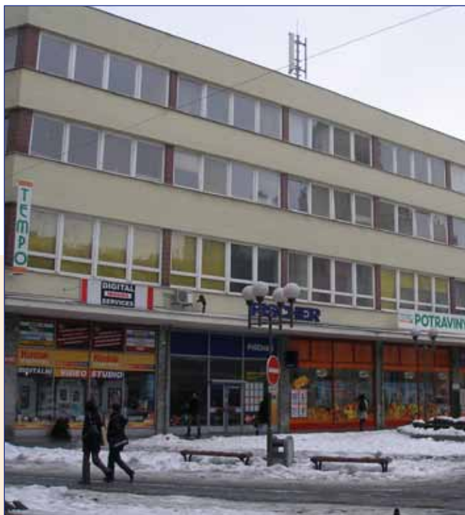
Ústředí OD Tempo Opava a oblíbená prodejna na Horním náměstí

Máme stále osm tisíc členů – vlastníků naší firmy. Člen v družstvu je