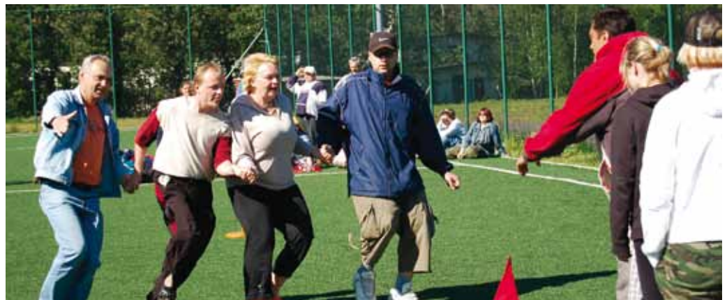
Skoro jako hry bez hranic působily sportovní soutěže zorganizované fyzioterapeuty zařízení PZOL. Naši byli lepší v individuálních soutěžích, hostitelé tvořili lepší týmy a vyhrávali společné disciplíny. Počasí prálo na prvním setkání, při druhém v červnu se hry musely odehrávat v tělocvičně.