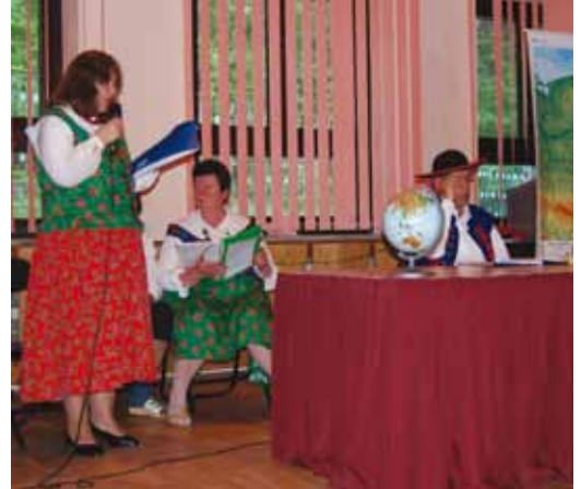
Polští hostitelé si na prvním setkání v květnu připravili program, který seznamoval s krajem kolem Żywce. Naši se nedali zahanbit a na červnovém pobytu předvedli, jak má vypadat správná „prajzula“ - nechte si to povyprávět.