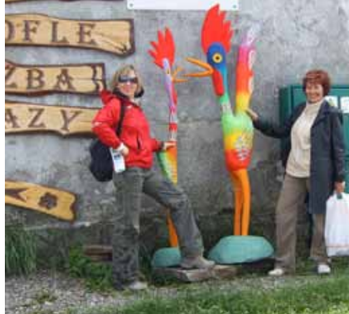
Legraci je možné zažít všude, i v prodejně místního řezbáře. Typické suvenýry z hor - výrobky za dřeva i turistické známky udělaly radost našim výletníkům.

PZOL je zkratka pobytového zdravotnického zařízení pro duševně nemocné v Polsku, které díky evropskému projektu příhraniční spolupráce mělo možnost navštívit 60 klientů a zaměstnanců Charity Opava a sprátených organizací. Název Medzibrodzie Bialskie, kde PZOL sídlí, vznikl tak, že odjakživa museli místní obyvatelé překonávat brody řeky Soła, která tudy teče. Nyní je řeka zkrocena několika nádržemi, původní domy byly zatopeny a výše vystavěny nové. Díky tomu již nehrozí záplavy a z oblasti v Beskydu Żywieckiem se stala turisticky atraktivní lokalita, kraj čisté vody a vzduchu, hor a vodních ploch. Je zde vodní elektrárna, lanovka na nejbližší horu Żar, možnosti lyžování, paraglidingu a další. Zveme Vás na malou exkurzi naší návštěvy.