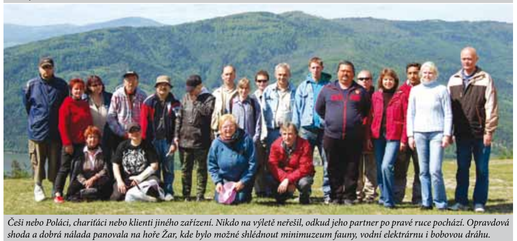
Češi nebo Poláci, charitáci nebo klienti jiného zařízení. Nikdo na výletě neřešil, odkud jeho partner po pravé ruce pochází. Opravdová shoda a dobrá nálada panovala na hoře Żar, kde bylo možné shlédnout minimuzeum fauny, vodní elektrárnu i bobovou dráhu.