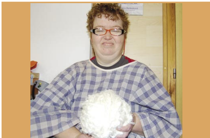
Hanka se ve svém chráněném bytě Domu sv. Cyrila a Metoděje pomalu zabydluje. Na fotce při sociální rehabilitaci, motání klubíček, ze kterých se pak bude tkát.

Jistě je potkáváte, možná na první pohled nejsou nápadní. Snaží se totiž žít plnohodnotný život – samostatně bydlet, chodit do práce, bavit se. Jsou to muži či ženy zrakově a mentálně postižení, obyvatelé Domu sv. Cyrila a Metoděje ve Vlaštických. Na návštěvě u jednoho manželského páru jsme zjistili, co se jim v domě líbí a proč se sem někteří po čase vracejí, třebaže z velké dálky.