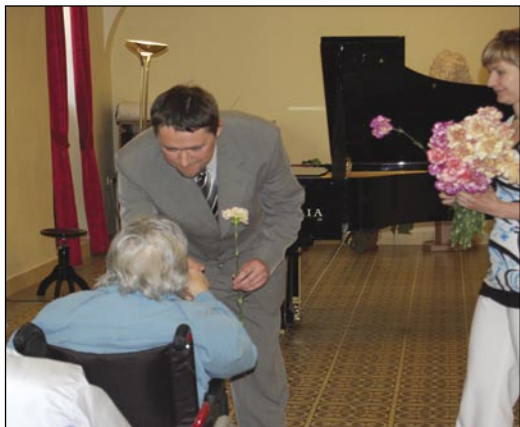
Den matek se slaví již tradičně a nyní je novinkou spojení organizačního týmu mateřského centra Neškola a Denního stacionáře pro seniory. Propojení služeb a akcí pro rodiny, děti a seniory, je dlouhodobým plánem těchto středisek