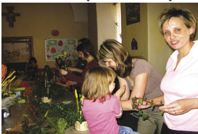
Aranžování velikonočních dekorací z darů přírody si užily v Neškole maminky i děti.

Velikonoce letos proběhly ve znamení velké aktivity na mnoha střediscích. Pracovníci, klienti i rodiče se postarali o to, aby nechyběla hezká výzdoba. Uskutečnil se také workshop velikonočního aranžování nebo prodej na Velikonočním jarmarku na Horním náměstí v Opavě.