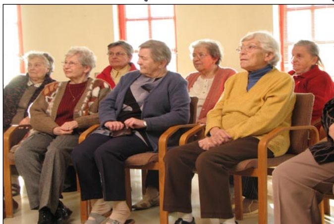
Společná akce Klubu sv. Anežky a Seniorcentra. Kulturní program zajistily děti...