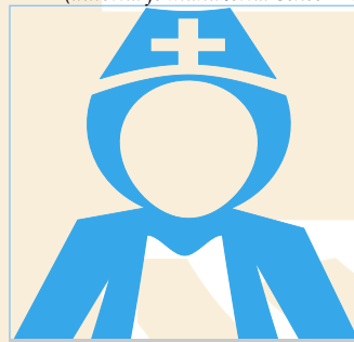
Charitní ošetrovatelská služba si 1.4. připomíná rok od rozdělení střediska.