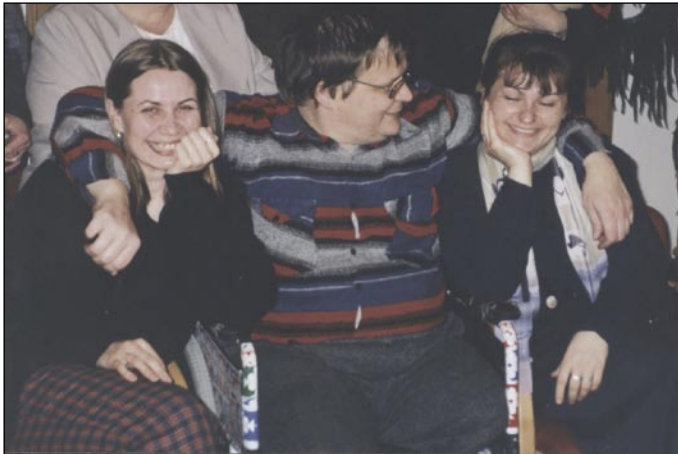
Zlaté časy? Mnoho zaměstnanců vzpomíná na dobu, kdy byla Charita „mladší“.

Rozpočet na několik desítek milionů, na dvě stovky zaměstnanců, necelé dvě desítky poskytovaných služeb a aktivit. Řeknete si: „Slušná firma!“ Jste kousek vedle. Jsme nevládní nezisková katolická organizace. Charita Opava.