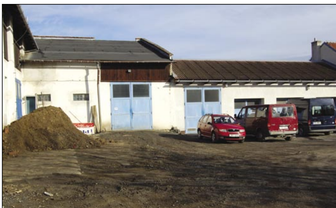
Chráněná dílna by se měla rozšířit do prostor nynějších garáží. Na fotografii je možno vidět i nevyhovující venkovní plochy.

V areálu bývalé JZD ve Velkých Hošticích naleznete prostory, kde se to hemží pracovníky, stroji, rozmanitými vyřazenými spotřebiči a jiným materiálem. Nadace OKD se rozhodla podpořit projekt „Rekonstrukce prostor pro chráněnou dílnu na využívání odpadů“. Reaguje na stále větší množství zpracovávaných odpadů v chráněné dílně ve Velkých Hošticích a nedobrý stav okolních venkovních ploch. Cílem je zrekonstruovat prostory garáží na novou dílnu a vyspravit venkovní plochy. V neposlední řadě se tím zlepší podmínky pro práci stávajícím 28 zaměstnancům. Důležitým aspektem Chráněné technické dílny je to, že spojuje problematiku životního prostředí a sociální otázky. Na separaci a zpracování odpadů jsou zaměstnání většinou lidé se zdravotním znevýhodněním. To jim přináší nejen možnost najít v této konkurenční době chráněné zaměstnání, ale také se dostat mezi lidi. Nespornou výhodou