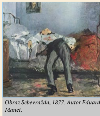
Obraz Sebevražda, 1877. Autor Edouard Manet.

(autorka je manažerkou Sekce PR Charity Opava)