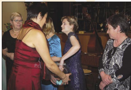
Losování o první cenu bylo opravdu napínavé.