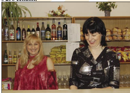
Kolegyně z Charity působily jako profi barmanky.

Plesu Charity Opava, který se konal 7. února ve Stěbořicích, se účastnilo na 250 hostů. Spokojenému obecnstvu zahrála cimbállovka Vojtek i taneční orchestr Pulsar. Před půlnocí čekala na hosty tombola s 236 cenami.