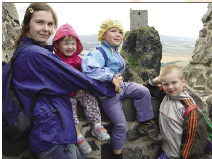
Na dovolené s rodinou v Českém ráji.