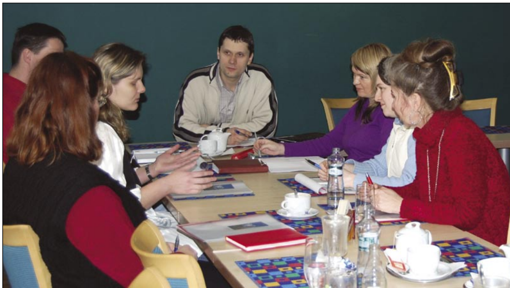
Vrcholové vedení Charity Opava řeší finanční problematiku organizace.

Ve srovnání s těmi předchozími je rok 2008 z pohledu financování značně odlišný. Charita Opava nerealizuje žádný projekt spolufinancovaný Evropskou unií, což způsobilo několikamilionový výpadek v příjmech. Rozhodnutí ředitele o šetření bylo přijato s rozpaky, nicméně přineslo své ovoce.