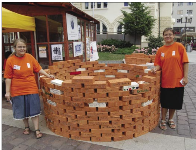
Vaše benefiční cihla pomůže ke štěstí dvěma lidem.

Dvěma mentálně postiženým lidem z Opavska se již brzy může splnit životní sen. Sen, který by pro ně byl vinou jejich postižení nedosažitelný. Dostanou svůj vlastní byt. A přispět k tomu můžete i vy, zaměstnanci a příznivci Charity Opava, když se zúčastníte celonárodní sbírky Akce cihla. Probíhat bude v květnu na opavském Horním náměstí a řadě dalších míst.