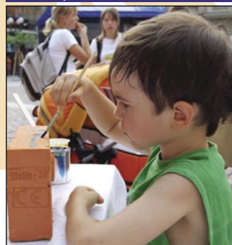
Přijďte si i vy namalovat svoji cihlu!