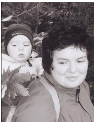
Na výletě v lese.