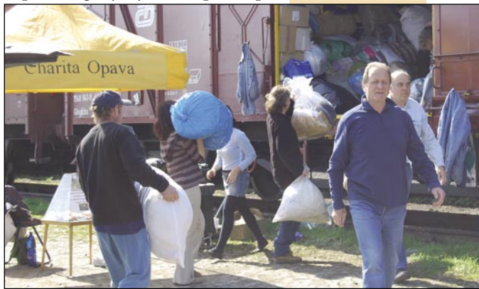
Po dva dny mířil k vagónům téměř nepřetržitý proud lidí.

Na nezájem občanů Opavska si Charita Opava rozhodně nemůže stěžovat. Vždyť namísto předpokládaných třech vagónů, připravených pro sběr šatstva během naší dubnové akce, jsme nakonec naplnili vagóny čtyři. A až po strop!