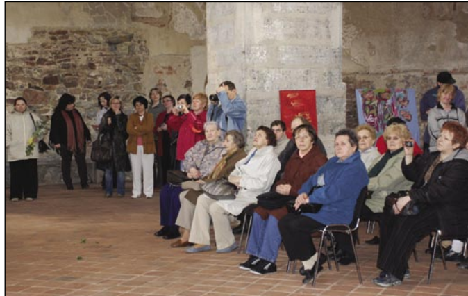
Výstavu velkých pláten shlédlo více než 800 lidí.

Kostel sv. Václava v Opavě hostil v dubnu Výstavu velkých pláten. Nevystavovali zde však světoznámí umělci ani význačné osobnosti, ale obyčejní lidé - klienti rehabilitačních dílen Charity Opava. Lidé přesto velmi nadaní, jejichž vnímání světa nás může o mnohé obohatit.