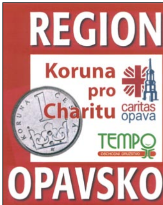
Logo propagující akci Koruna pro charitu.

Pod názvem KORUNA PRO CHARITU odstartovala počátkem března společná akce týdeníku REGION OPAVSKO, obchodního družstva TEMPO a CHARITY OPAVA. Každý týden tak díky spolupráci těchto tří důležitých firem Opavska přibudou na náš charitní účet další finance.