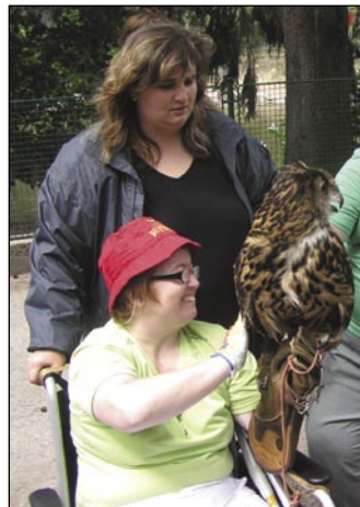
Na výletě v ZOO.