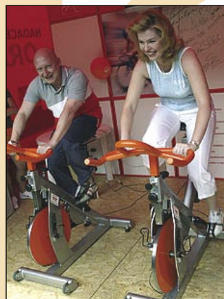
Takto nějak vypadá oranžové kolo.

(autor je vedoucí Denního stacionáře Mraveneček)