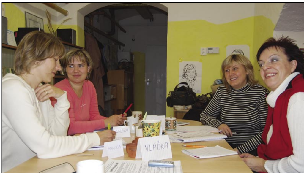
V Charitě Opava právě probíhá 160hodinový kurz pro pracovníky v sociálních službách.

Stejně jako „bez spojení není velení“, tak ani bez vzdělaných zaměstnanců se kvalitní sociální služby neobejdou. Charita Opava na tento účel vynakládá nemalé prostředky a nebude tomu jinak ani v roce 2008.