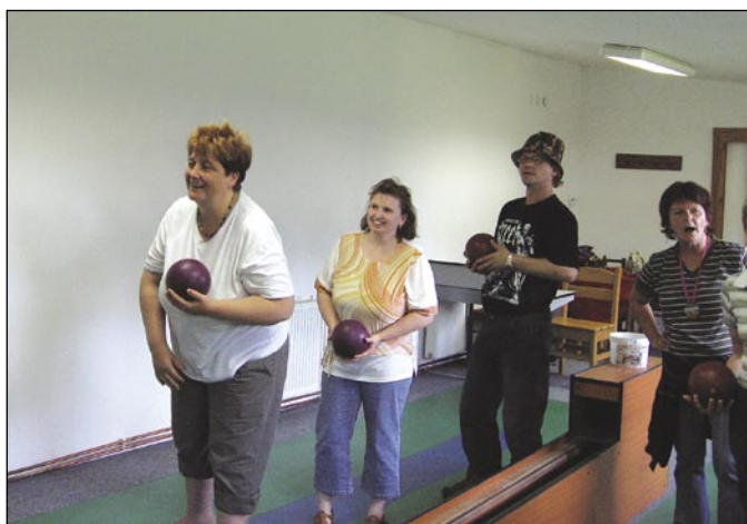
Ani turnaj v kuželkách se neobešel bez povzbuzování a smíchu.