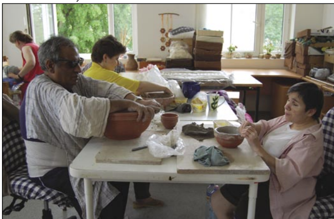
Práce v chráněné dílně je různorodá. Na snímku výroba keramiky.