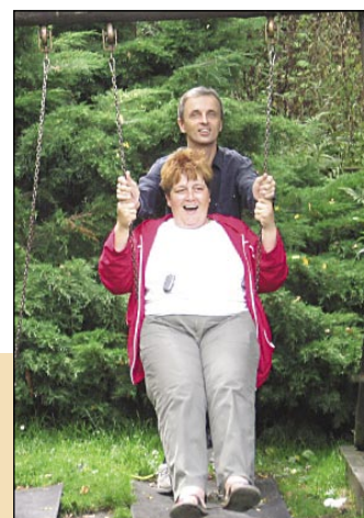
Ralaxace na houpačce.

V těchto dnech byla dokončena jedna z největších zakázek keramické dílny Chráněných dílen sv. Josefa, která ve finančním objemu přesahuje částku 100 tisíc korun. Dárkové keramické předměty si objednala finská farmaceutická společnost ORION PHARMA, která má zastoupení v Praze a Bratislavě. Celkem 700 kusů keramických sad se nepřetržitě vyrábělo od letošního června. Byla spotřebováno více jak tuna keramické hlíny a přes 30 kilo barevných glazur.