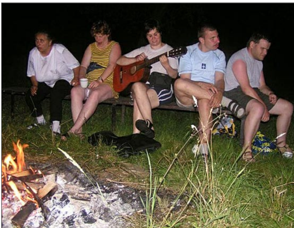
Uživatelé služeb Domu sv. Cyrila a Metoděje pro zrakově postižené našli ve Vlašovičkách svůj druhý domov.

Připravované změny v chráněném bydlení se staly posledních týdních hlavním tématem vzrušených debat našich klientů z Vlašoviček. Mnozí z nich je totiž vnímali jako své ohrožení. Ačkoli se toto nedorozumění snad již vysvětlilo, určitě pro nás bude poučné se s jejich názory, stesky a obavami seznámit.