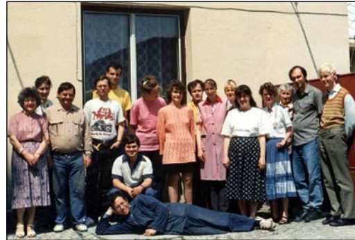
Kolektiv dílen před budovou na Březinově ulici asi v roce 1995.