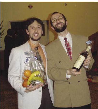
Poznáte se na společenském večeru z Otic z roku 2002? Tak se radovali kolegové z výhry v tombole v roce 2005 na plesu ve Stěbořicích