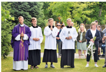
• Vzpomínkového setkání na otce Jožku se zúčastnili pracovníci a klienti řady středisek opavské Charity.