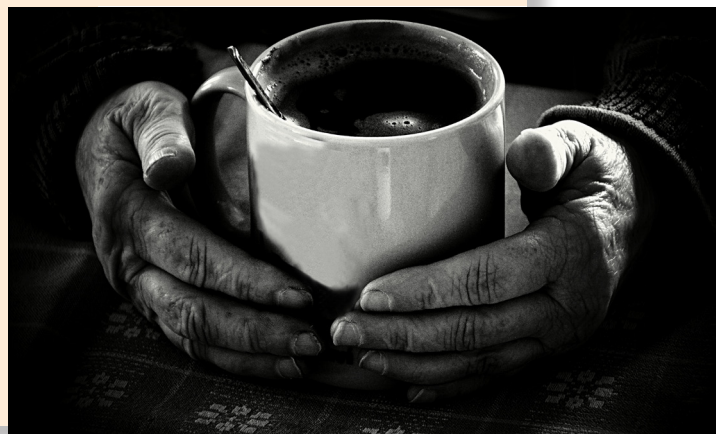
ŽIVOT KOLEM NÁS 1. místo: Tereza Skoupilová, Prostějov