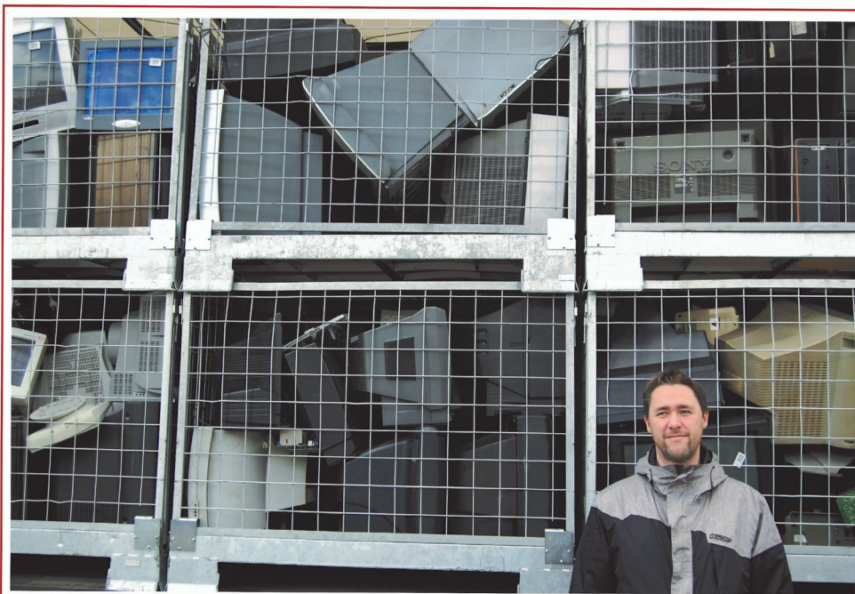
Chráněné technické dílny ve Velkých Hořticích kromě zaměstnávání zdravotně znevýhodněných občanů přispívají k ekologické likvidaci odpadů v opavském regionu.