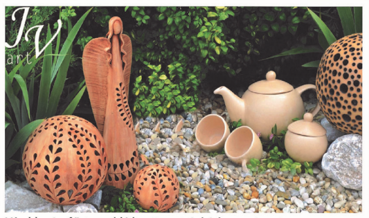
Výrobky si můžete prohlédnout na stránkách www.jv-art.cz .