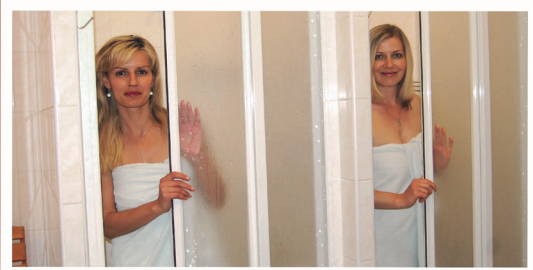
Náhradní plnění může mít i podobu zakoupení ročních poukazů na zdravotní či relaxační masáže a procedury wellness centra, v nichž své dovednosti prokazují především zrakově handicapovaní maséři.

Panenu Emu, která se stala maskotem lázní v Klimkovcích, vymyslely a vyrábí charitní Chráněné dílny sv. Josefa.