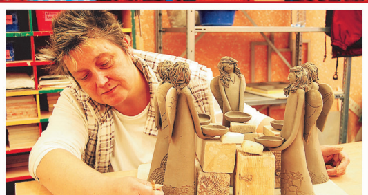
Chráněné dílny v Jaktai a Vlaštickách vyrábějí krom jiného krásnou keramiku, která může obsahovat loga zadavatele.