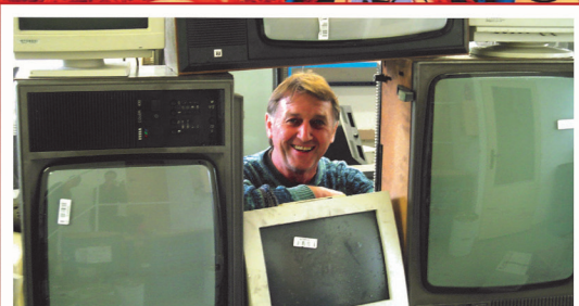
Jednou z forem náhradního plnění je také skartace dokumentů a likvidace odpadů včetně elektroodpadu a nebezpečného odpadu.